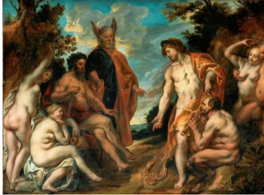
Jugement du roi Midas, peint par Jacob JORDAENS (XVII e siècle)